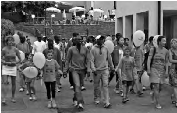
Kenianische Marathonläufer und Völser Kinder beim gemeinsamen Einzug.

Alle Jahre wieder, und das nicht nur zur Winterszeit: Sommer in Völs bedeutet zugleich auch Dorfzauber. Reges Treiben, Spiel und Spaß bringen an lauen Sommerabenden Leben in das Völser Ortszentrum.