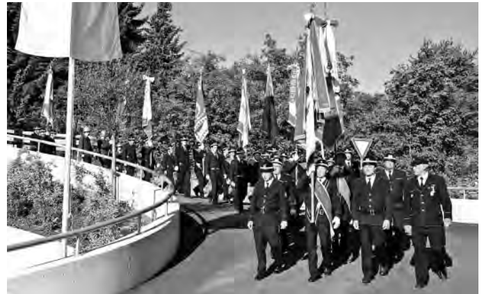
Feierlicher Einzug der Feuerwehr Völs mit den Abordnungen der Nachbarwehren und der Musikkapelle Völs.

gierung sehr wohl für die Infrastrukturen sorgen könne, damit sie aber mit Leben gefüllt und nützlich werden, dafür seien die Menschen zuständig. Dass es Leute gibt, die gerne geben, mache die Lebensqualität in unserem Lande aus, so der Landeshauptmann; bei uns könne jeder etwas finden, an dem er mit Freude mitarbeitet. Die Palette reicht von der Musikkapelle, über BRD und sozialen