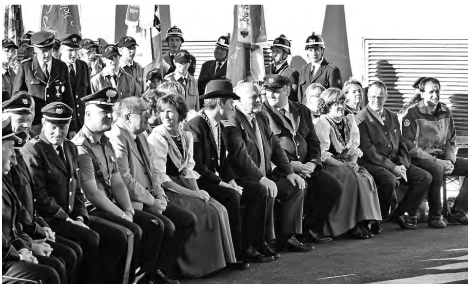
Auch Landeshauptmann Luis Durnwalder war zur Feier gekommen.