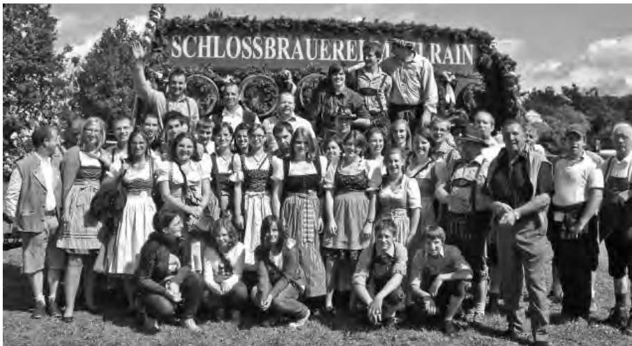
Die Musikkapelle Völs zu Gast in der Schlossbrauerei Maxlrain.