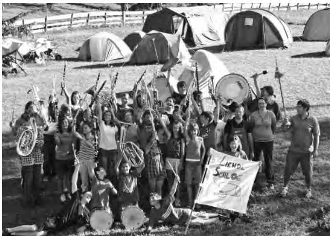
Alle Teilnehmer samt Betreuer und Lehrer und der Liendl Schlog-Fahne