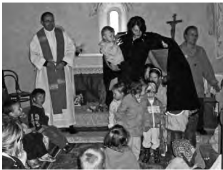
Krabbelgottesdienst im Mai 2010 in der Kirche Peterbühel.

Wie jedes Jahr traf sich auch heuer wieder der Ausschuss der Katholischen Frauenbewegung im August zu einem gemütlichen Beisammensein auf der Liendl Schlog. Neben Kaffee und Kuchen und einer guten Marende stand der Austausch über das kommende Arbeitsjahr im Vordergrund.