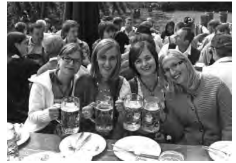
Na, dann Prost auf dem Hopfazupfa Fest.

rainer trinkt Maxlrainer“ fühlten wir uns verstanden und wohl. Nach der kleinen Stärkung führte uns der Direktor höchstpersönlich durch die Brauerei: Sudhaus, Gärkeller, Lagerkeller, Abfüllung. An die verschiedenen Gerüche musste man sich erst einmal gewöhnen. Die bayerische Herzlichkeit nahm nach der Führung kein Ende und wir wurden zum Mittagessen eingeladen: Ochsenbraten, Spatzlen und Bratwürste standen auf der Speisekarte. Verschiedene Musikgruppen umrahmten das Fest und der Höhepunkt war natürlich das Hopfazupfa (zu deutsch: Hopfen zupfen). Es wurde um die Wette gezupft und wer innerhalb weniger Minuten am meisten Hopfen in einen Korb gezupft hatte, war der Sieger. Unser Ferdl sonderete sich bald ab, setzte sich inmitten des Hopfenfeldes und zupfte und zupfte so lange bis er eine Kiste Bier dafür