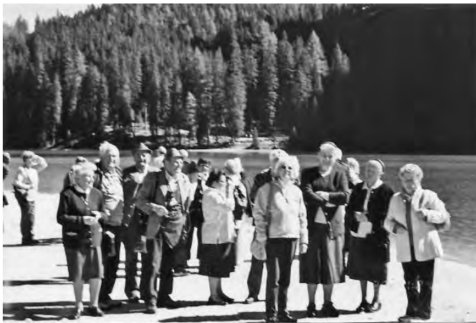
Beim Pragser Wildsee