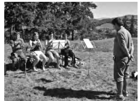
Es stimmt und klingt